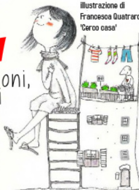
Illustrazione di Francesca Quatraro 'Cerco casa'